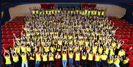
293 alunos presentes.