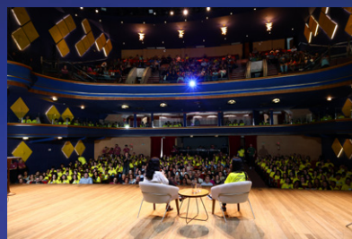
Teatro do Sesc Glória, lotado de alunos, familiares, equipe, parceiros e voluntários.