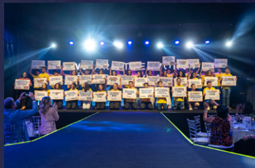
Universitários apresentando suas conquistas.