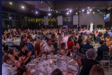
Salão lotado com convidados.