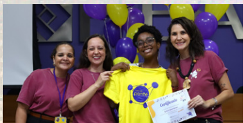
Equipe entregando certificado e uniforme a nova aluna selecionada em 2024.

Após 5 meses de processo seletivo, ingressou a maior turma da história do Instituto Ponte: 90 alunos selecionados de 13 estados diferentes, que serão acompanhados até a conclusão do ensino superior. Seguimos no caminho traçado pelo nosso conselho estratégico, acreditando que o objetivo de dobrar o número de alunos até 2029 está cada vez mais próximo.