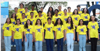
Parte da nova turma, na Aula Inaugural que ocorreu em 03/08 em nosso espaço pedagógico (Vitória/ES).