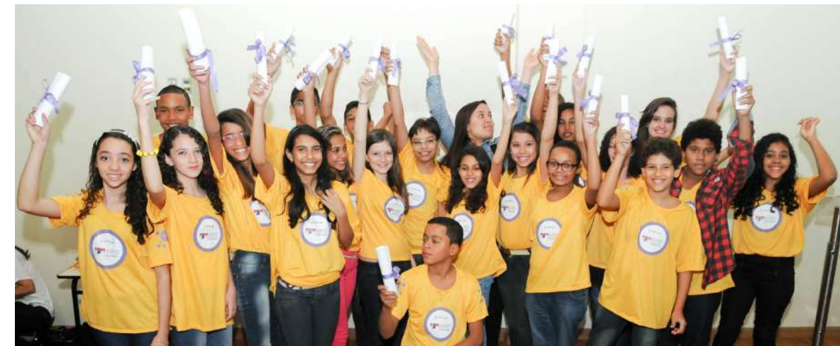
Bons alunos capixabas com seus diplomas entregues durante a aula inaugural