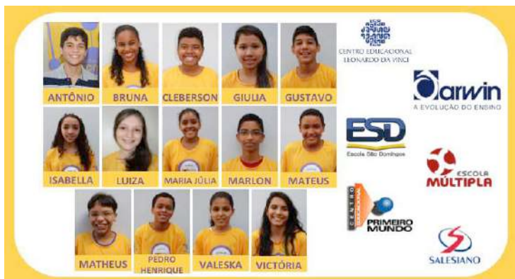
Em 2016, 14 alunos do Instituto Ponte terão a oportunidade de estudar em escolas particulares através de bolsas de estudo.