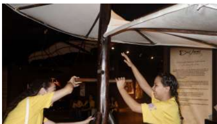
Alunos interagindo com peças da exposição "Da Vinci a exibição".